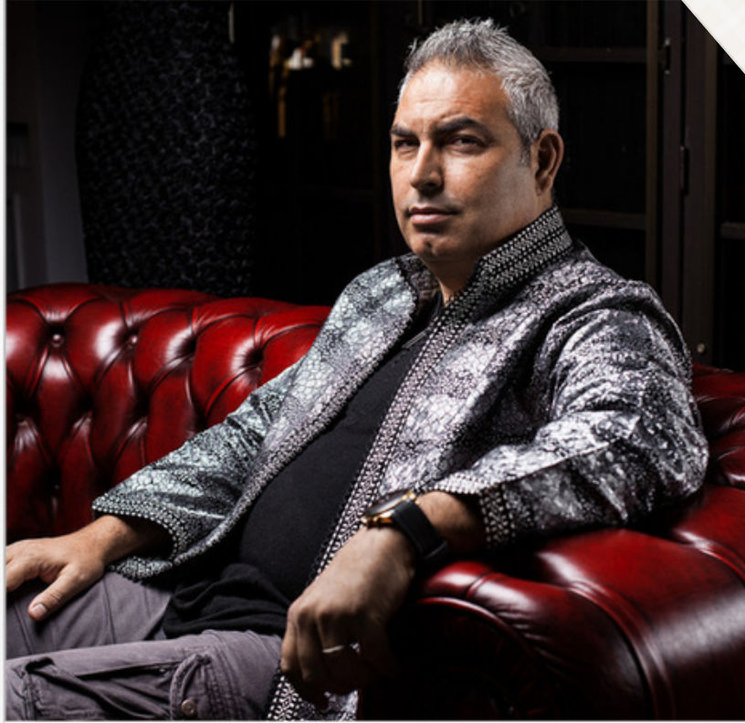
محمد عهد بنسودة مخرج مغربي

تم إضافة الفيلم السينمائي الطويل "مطلقات الدار البيضاء"، الذي أخرجه المبدع المغربي محمد عهد بنسودة، إلى قائمة إنجازاته بعد مشاركته في المسابقة الرسمية للمهرجان الدولي للسينما ببغداد في دورته الأولى.