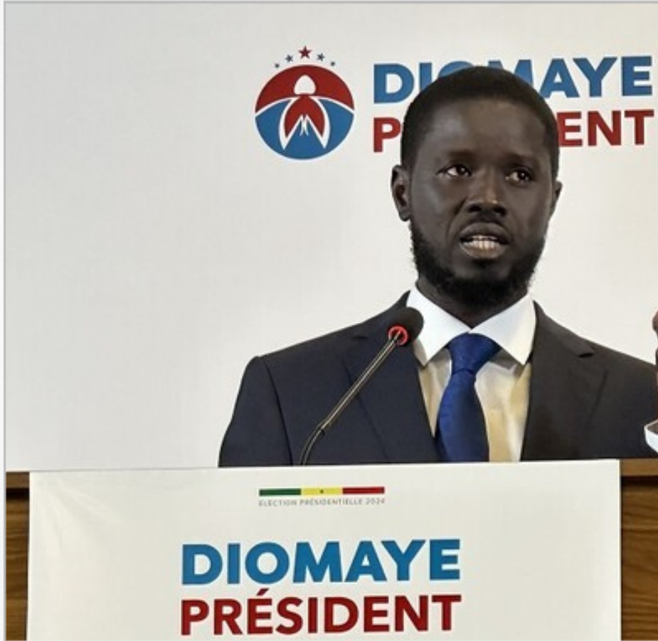
رئيس دولة السنغال "باسيرو ديوماي فاي"

الرئيس السنغالي الجديد في مأزق !!! باسيرو ديوماي فاي مطالب باختيار السيدة الأولى بين زوجته