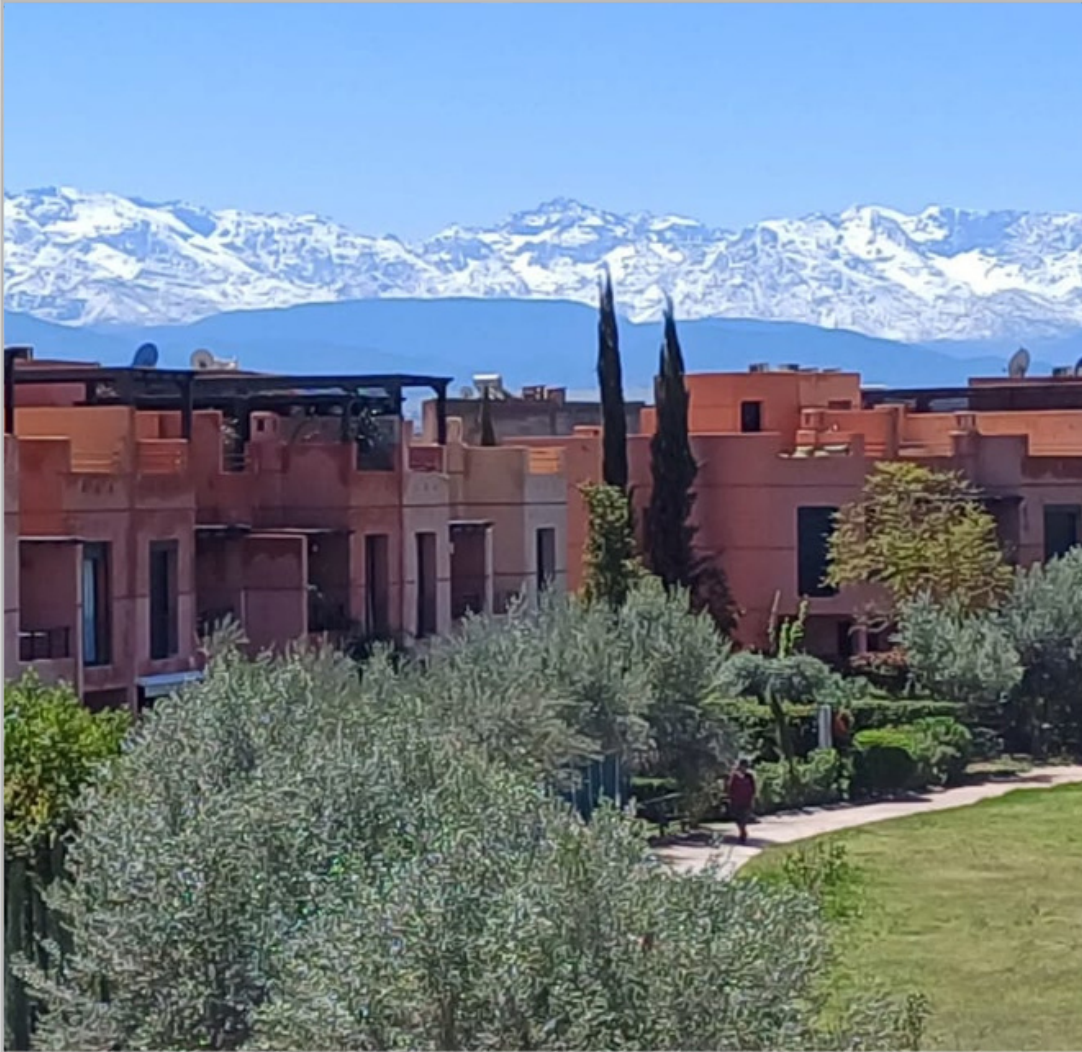
جبال الأطلس الكبير تكتسي حلة بيضاء